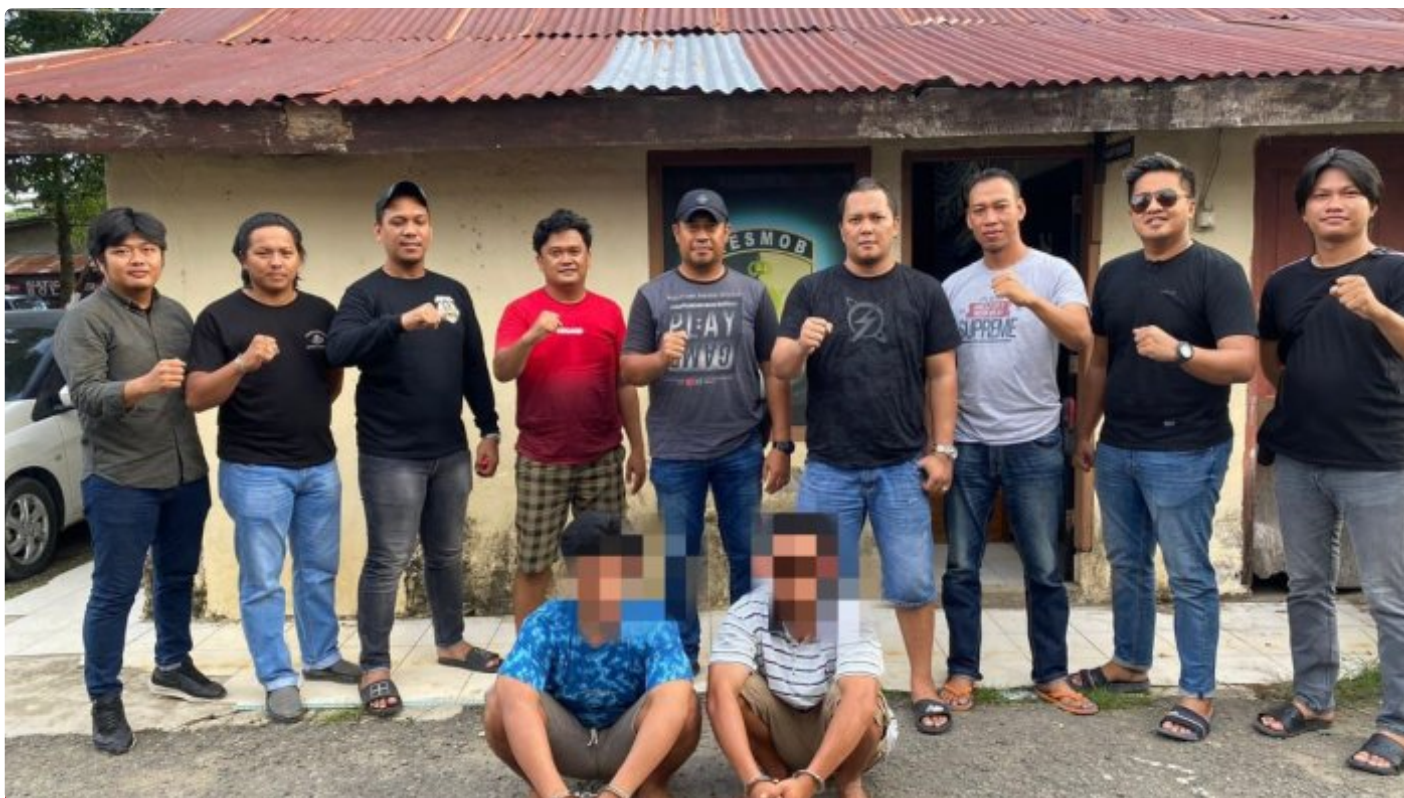
Tim Resmob Reskrim Polres Morowali saat menangkap pelaku pembunuhan

MOROWALI, Sulawesi Tengah- Pelaku penikaman perut terburai keluar hingga menyebabkan korbannya meninggal dunia inisial E (29) yang baru-baru ini terjadi di wilayah Kecamatan Bahodopi telah berhasil di tangkap Satreskrim Polres Morowali.